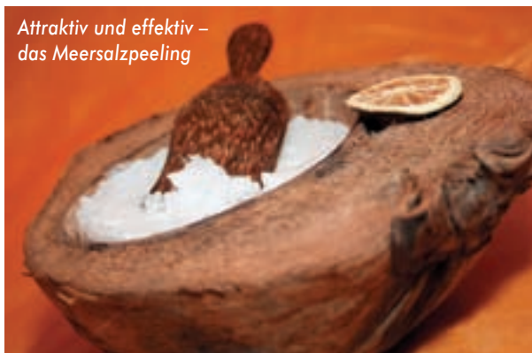
Attraktiv und effektiv – das Meersalzpeeling

■ Nach dem Fußbad folgt die Thai-Yoga-Fußmassage . Dazu bekommt die Kundin Socken angezogen, die ein Auskühlen der Füße verhindern und