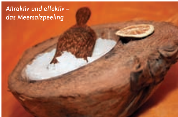
Attraktiv und effektiv – das Meersalzpeeling

auch für die besondere Art der Massage notwendig sind: Druckpunkte auf der Fußsohle und Dehnungen werden miteinander kombiniert. So werden die Gelenke gelockert und sogar das ganze Bein wird mit wohldosiertem Zug bis zur Hüfte bewegt. Ruhige und aktive Phasen wechseln sich bei dieser Fußmassage harmonisch ab.